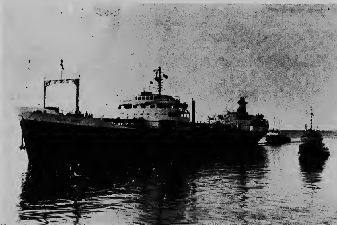
Awe mainta e barcu Pearl River a ser di tow den haaf di Corsouw pa reparacion. E barcu aki tabata tini un candela chiquitu abordo y su motornan y varios otro equipo no tabata funciona mas. Aki nan lo e ser drecha den dok.

WASHINGTON --UPI -- Dos norteamericano hoben, quendenan a ser detene 46 dia pasa pa autoridadnan sovietico, ta a punto di ser somete na juicio segun tata di un di nana informa.